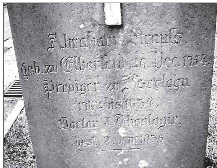
Sein Grabstein erinnert auf dem Iserlohner Hauptfriedhof bis heute an den populären Prediger.